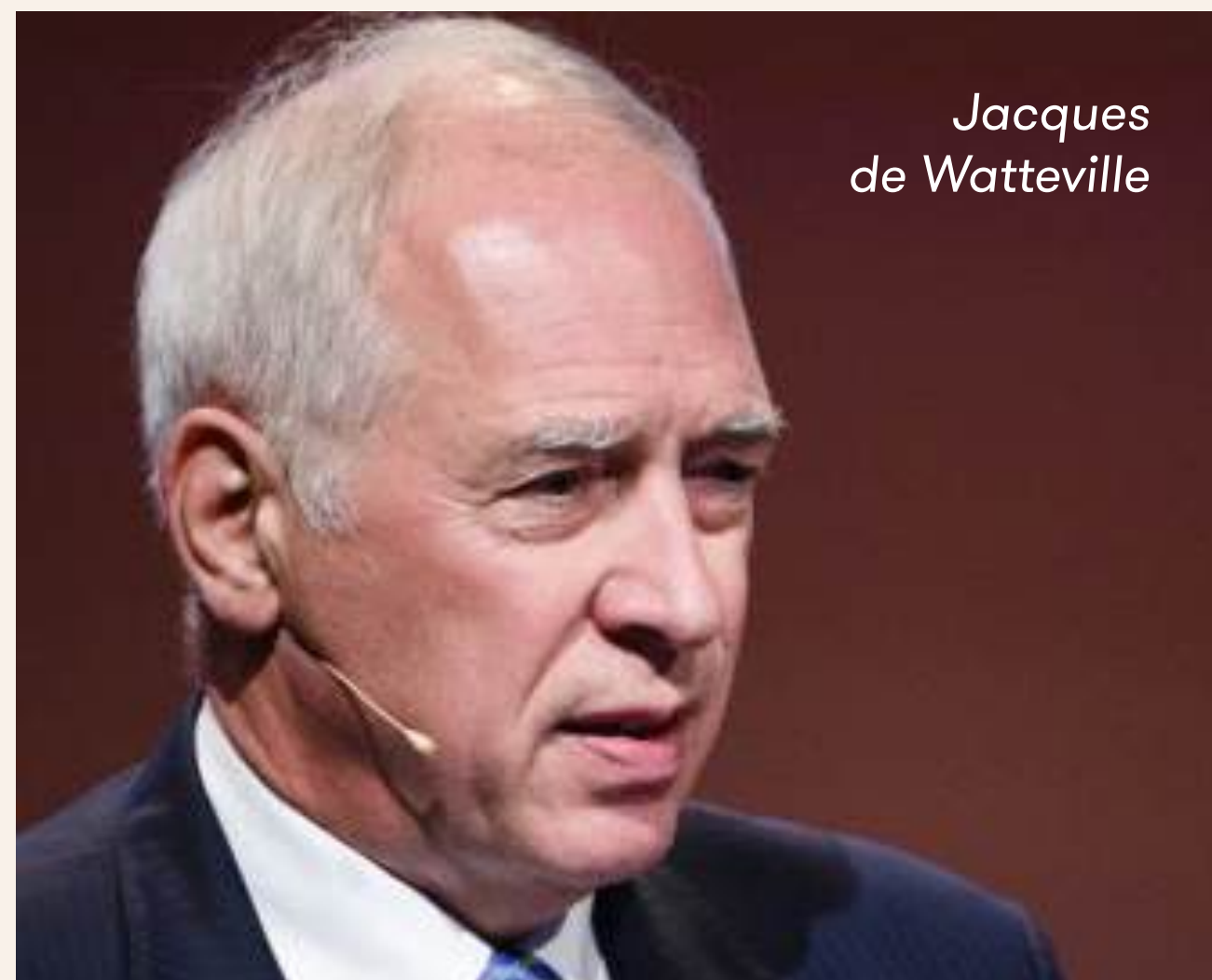
Jacques de Watteville